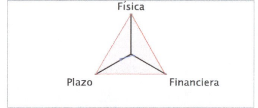
Gráfica de Ejecución