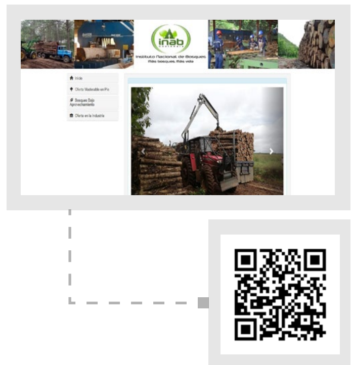
Imagen de la herramienta sobre Mercados Forestales

Las plataformas constituyen una opción innovadora para el sector forestal, un sector que demanda nuevas estrategias para tener acceso a más y mejores mercados.