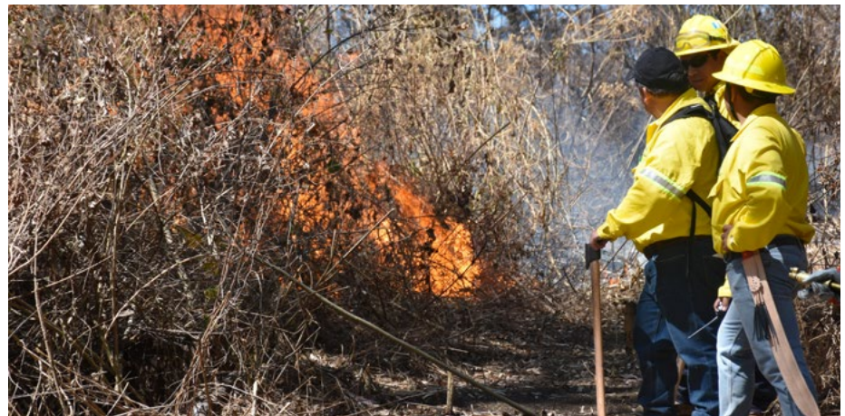
Figura 2. Ejecución de quema prescrita, con el objetivo de reducción de combustibles. Realizada en bosque Robledal-Pinar.