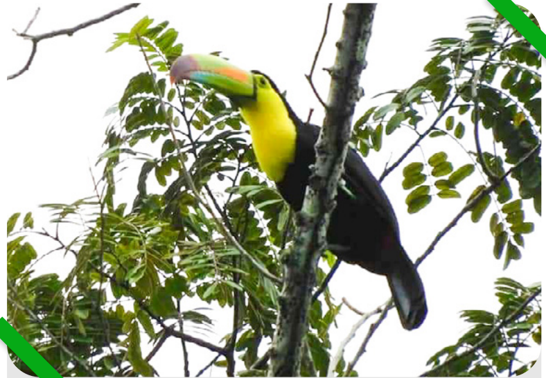
Parque Nacional El Rosario

Dentro de los parques podemos encontrar 500 especies de fauna, conformados por aves, mamíferos, reptiles, anfibios y peces; Más de 50 de estas especies se encuentran bajo algún grado de amenaza o en peligro de extinción. También son hábitat de 900 especies de árboles y flora; entre las